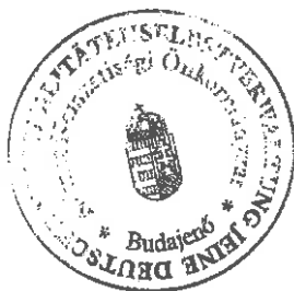
Éhleiter Tünde jegyzőkönyv-hitelesítő