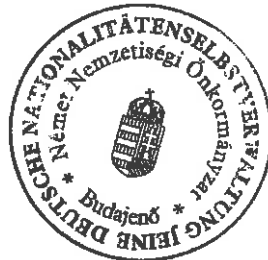
Éhleiter Tünde jegyzőkönyv-hitelesítő