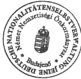
Éhleiter Tünde jegyzőkönyv-hitelesítő