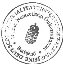
Éhleiter Tünde jegyzőkönyv-hitelesítő