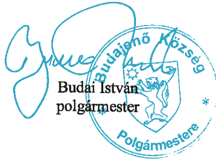
Budai István polgármester

3. § Jelen rendelet a kihirdetést követő napon lép hatályba, és az azt követő napon hatályát veszti.